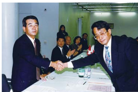
平成5年9月 スイスフラン建新株引受権付社債を発行