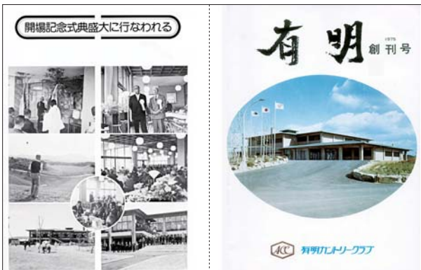
昭和49年10月 有明カントリークラブ大牟田ゴルフ場営業開始