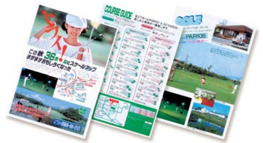
平成5年10月 三井グリーンランドゴルフ場が合計36ホールになる