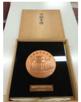
平成4年12月 大阪証券取引所市場第2部に上場