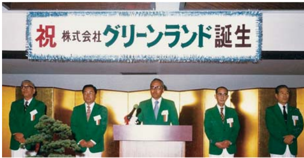
昭和55年1月 株式会社グリーンランド設立