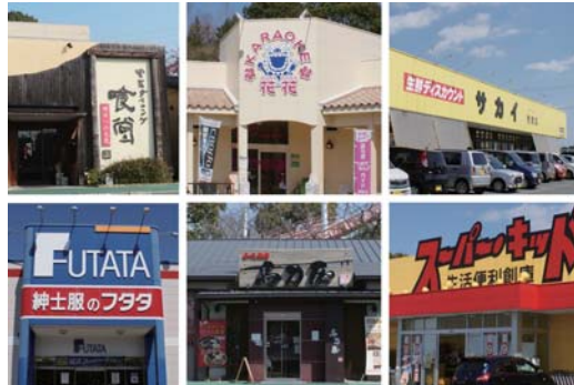
平成18年11月 グリーンスマイル一番館営業開始