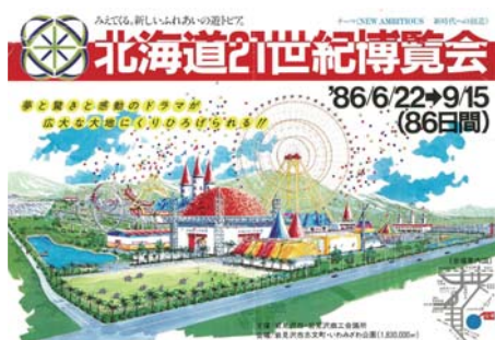
昭和61年6月 北海道三井グリーンランド遊園地営業開始