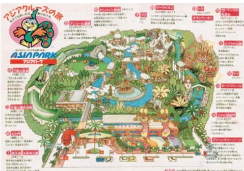
平成5年7月 アジアパーク営業開始