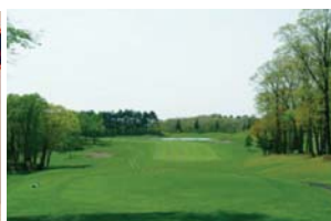
<エムズゴルフクラブとの契約調印式(2013.8.5.)・コース概観>