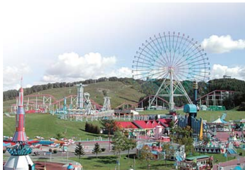
平成19年4月 遊園地を含む、いわみざわ公園全体の運営管理を開始