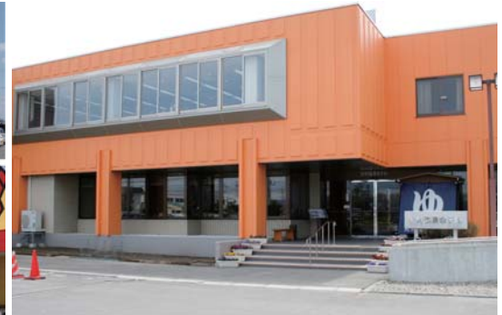
平成22年7月 北村温泉ホテルの運営管理を開始