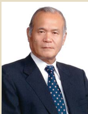
グリーンランドリゾート株式会社 代表取締役社長

これからも、レジャー業界をとりまく環境が多様化する中、心のこもったおもてなしやサービスで、最高の思い出となる「時間」と「空間」を提供し、お客様の「ココロをみどりでいっぱいにする」ことで、夢や感動を与える企業であり続けるよう邁進してまいりますので、なお一層のご支援、ご高配を賜りますようお願い申し上げます。