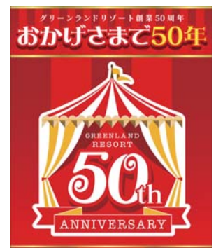
平成26年9月 グリーンランドリゾート創業50周年