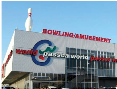
平成17年4月 パスカワールドグリーンランド営業開始