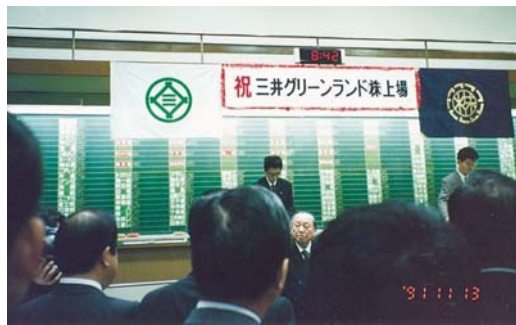
平成3年11月 福岡証券取引所に上場