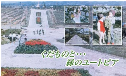
昭和41年7月 三井グリーンランド遊園地営業開始