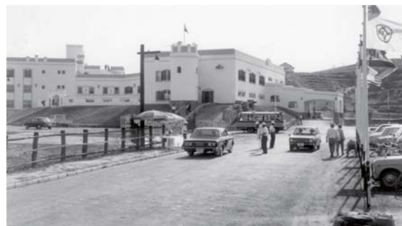
昭和41年9月 三井グリーンランドホテル営業開始