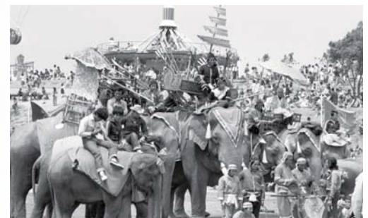
昭和51年3月 西日本新聞社主催で第1回九州こども博開催