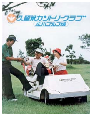
昭和54年4月 久留米カントリークラブ広川ゴルフ場営業開始