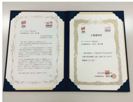
平成25年7月 東京証券取引所市場第2部に上場