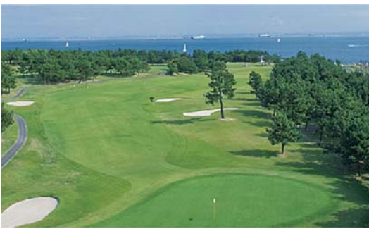
平成2年 若洲ゴルフリンクスのコース管理業務・キャディ業務を開始