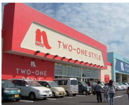
平成23年9月 ナフコ荒尾東店営業開始